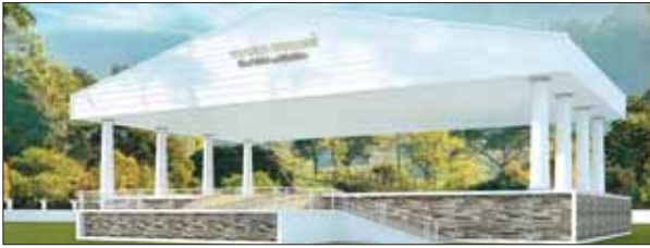
ഹെബ്രോൻപുരത്ത് നിർമ്മിച്ച കൺവൻഷൻ സ്റ്റേജ്