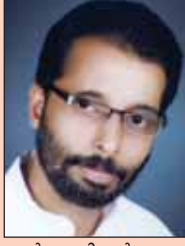
പാസ്റ്റർ അനിയൻകുഞ്ഞു ചെടിയത്ത്