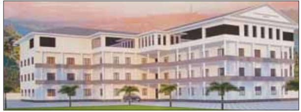
പണി പൂർത്തിയാകുന്ന ഇന്റർനാഷണൽ കെട്ടിട സമുച്ചയം