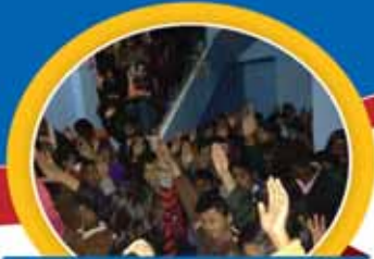
PROMISE OF LOVE