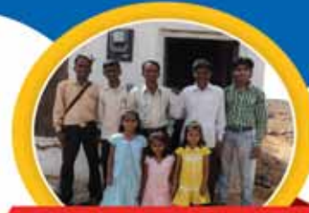
STEWARDS OF GRACE