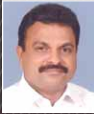
സ്റ്റാഫ്സ് മേമ്പർ (പണ്ഡിതൻ)