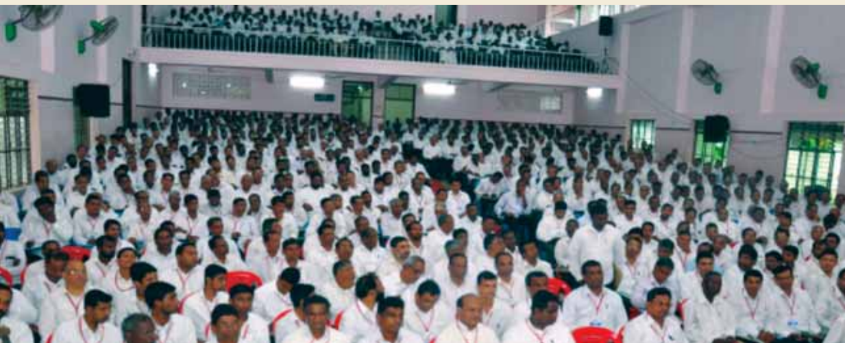
സൗത്ത് സോൺ ശുശ്രൂഷക സമ്മേളനം