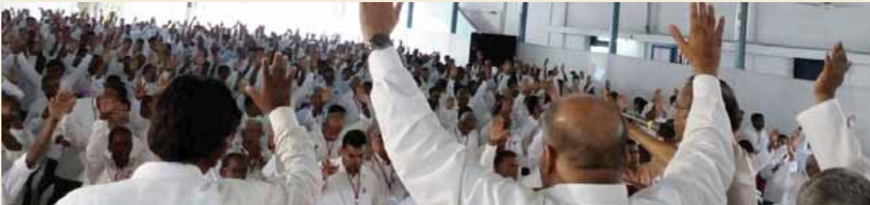
സെൻട്രൽ സോൺ ശുശ്രൂഷക സമ്മേളനം

പ്രതിസന്ധികളും വെല്ലുവിളികളും തുണവർഗ്ഗമായിച്ചുകൊണ്ട് ഈ വർഷത്തെ ശുശ്രൂഷക സമ്മേളനങ്ങൾ ചരിത്ര വിജയമാക്കി തീർത്ത കേരള സംസ്ഥാന കൗൺസിൽ തീർച്ചയായും അഭിനന്ദനം അർഹിക്കുന്നു. തുടർന്നും ദൈവരാജ്യത്തിന്റെ വ്യാപ്തിക്കായി നമ്മുക്ക് ഒരുമിച്ചു പ്രവർത്തിക്കാം.