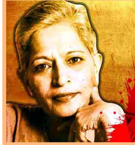
ഒരിക്കലും എഴുത്തിന്റെ പിന്നിലെ സത്യം കൊല്ലപ്പെടുത്തില്ല. ഓരോ കൊലപാതകത്തിന്റെ പിന്നിലും പ്രത്യക്ഷമായി നാമറിയാത്ത പലതുമുണ്ടാകാം. കൊലപാതകം ഓർമ്മയിലിരിക്കുന്നു. എഴുത്തിന്റെ പിന്നിലെ സത്യം കൊല്ലപ്പെടുത്തില്ല. ഓരോ കൊലപാതകത്തിന്റെ പിന്നിലും പ്രത്യക്ഷമായി നാമറിയാത്ത പലതുമുണ്ടാകാം. കൊലപാതകം ഓർമ്മയിലിരിക്കുന്നു.

കൊലപാതകങ്ങളുടെ ആവരണം നൽകുന്നതിന്റെ ഉദ്ദേശം. ഇതരമതങ്ങളുടെ പ്രാർഥനാലയങ്ങൾ ഒരു കാലത്ത് ഹിന്ദുക്കളേകൂടാതെ മറ്റുള്ളവർക്കും അവയോടൊരു കൂട്ടം കൂട്ടിക്കൊണ്ടിരിക്കുന്നു. മതേതരത്വത്തിൽ അവിശ്വാസം ജനിപ്പിച്ചു. അസംബന്ധമാക്കി സമാന്യ മതപരമായൊരു രൂപകങ്ങളിലും ഇടപെടുകയാണ് ഇതിന്റെ യഥാർത്ഥ ലോകത്തെ കീഴടക്കാമെന്ന് അവർക്കറിയാം. ദേശീയതയിലും അതിനായുമായ രൂപകങ്ങളിലും ഇടപെടുകയാണ് ഇതിന്റെ യഥാർത്ഥ ലോകത്തെ കീഴടക്കാമെന്ന് അവർക്കറിയാം. ദേശീയതയിലും അതിനായുമായ രൂപകങ്ങളിലും ഇടപെടുകയാണ് ഇതിന്റെ യഥാർത്ഥ ലോകത്തെ കീഴടക്കാമെന്ന് അവർക്കറിയാം. ദേശീയതയിലും അതിനായുമായ രൂപകങ്ങളിലും ഇടപെടുകയാണ് ഇതിന്റെ യഥാർത്ഥ ലോകത്തെ കീഴടക്കാമെന്ന് അവർക്കറിയാം.