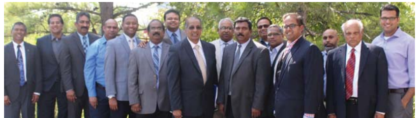
നോർത്ത് അമേരിക്കൻ ചർച്ച് ഓഫ് ഗോഡ് കോൺഫ്രൻസിന്റെ നാഷണൽ കമ്മിറ്റി അംഗങ്ങൾ

ഡാളസ്: 2018 ജൂലൈ 19 മുതൽ 22 വരെ ഒക്കലഹോമയിൽ നടക്കുന്ന 23-ാമത് നോർത്ത് അമേരിക്കൻ